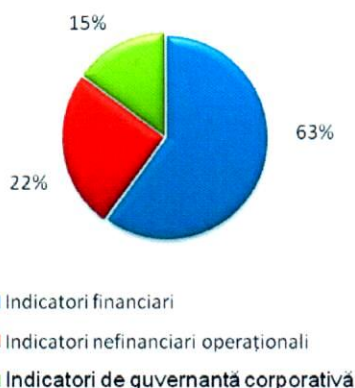
Prezentare grafică: Structura IP din Contractele de mandat ale administratorilor